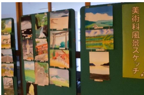
【美術科 風景スケッチ】