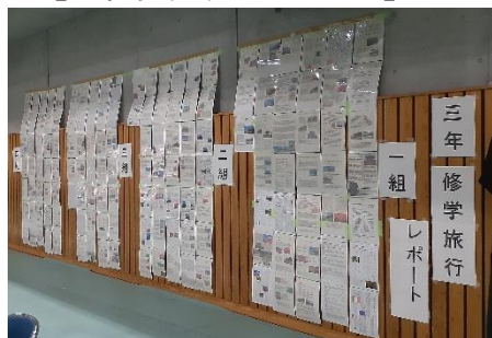
【3年修学旅行レポート】