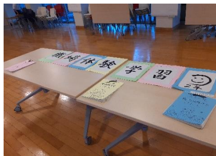
【2年職場体験レポート】