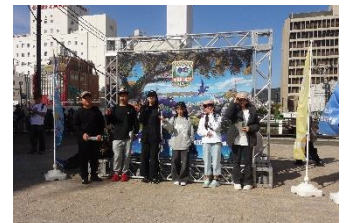
グループでのフィールドワーク