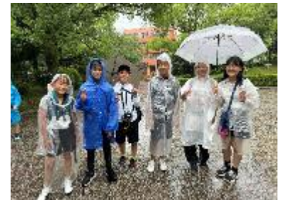
グループで協力できました!