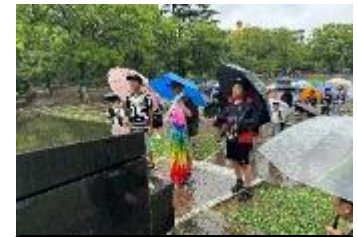
爆心地公園での平和集会