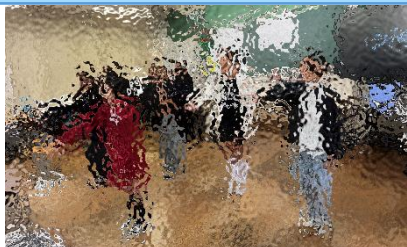
4年松組総合的な学習 発表会