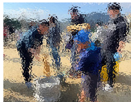
3年生の餅つきの様子

先週日曜日は授業参観と PTA 行事である親子餅つき会に多数のご参加ありがとうございました。1 時間目授業参観が 8:25 と早い時間設定でしたので、来ていただけるか不安に思っていたのですが、どの教室もたくさんの保護者様で驚きました。10 年前は餅つきの準備で忙しくされていて、参観される保護者さんはほんの数人でした。しかしこの行事一番の目的が「子供に餅つきの体験をさせ、親子一緒にもちを食べて、楽しい時間を過ごす。」ことだと思うので、今のスタイルが学校と家庭、双方のニーズにマッチしているのだと感じました。と言っても、前日から(役員さんはもっと前から)たくさん準備をしておられました。また、PTA と地域連携室とで相談され、「星の会」の皆様には餅を丸める作業がスムーズにできるよう、各学年一名ずつ入っていただくこととしました。その見えない下準備とご協力なくして、餅つき会は成立しません。本当に皆様のご協力に感謝です。当日は餅をつく前に、地域サポーターの皆さんへの感謝の会が行われました。また、〇〇さんの紹介と PTA からの表彰等、盛沢山でしたが、5 年生の進行のもと、心温まる時間となりました。PTA 会長さんのマイクによる実況中継がさらに場を盛り上げていたようです。会長さんありがとうございました。63kg の餅米は、稲作体験にご協力いただいている△△様よりいただいています。美味しいお餅になって、子供たちの心と胃袋を満たしてくれたようです。保護者の皆様も本当にありがとうございました。