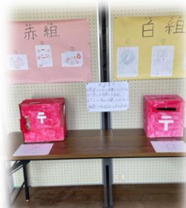
5/21の運動会も楽しみます（^_^）