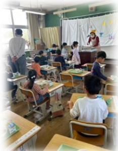
1年生 はじめての給食はカレーでした（^_^）

『子どもの視点に立ち、子どもを肯定的にみる』『子どもの意思を尊重し自発性を育てる』『意図的に働きかけて、一人一人の子どもを生かす』『学び続ける姿を通して、学ぶ意義を伝える』このような視点を共有し、安心して学ぶことができる環境づくりに努めます。子どものやる気を高め、主体性を育むための合言葉は「ほめるから、はじめる。はじまる。」です。（構想図は裏面をご覧ください。）