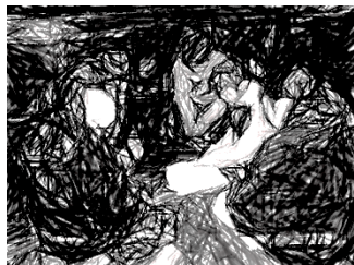
たてわりリーダー会