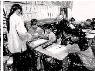
6年生への手紙書き