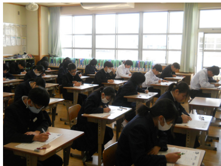
真剣に学習に取り組む9年生

どの決まりも基本的なことばかりですが、まずはこうした生活習慣・学習規律をしっかりと身に付けることで、子どもたちの学力を高めていきたいと考えています。合わせて、文部科学