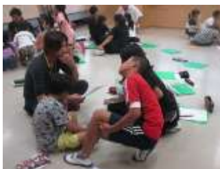
グループでの聞き取り学習