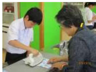
アイロンを使っての仕上げ