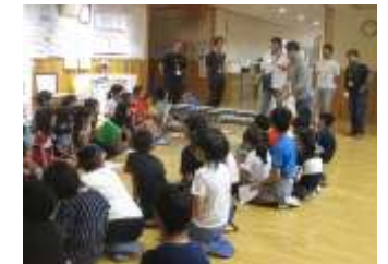
海苔摘み取り機での実演