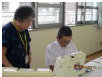
ミシンを使って縫う

中学部では、7年生の家庭科での裁縫実習に協力して頂き、6月12日（水）と26日（水）に来られました。裁縫はミシンを使い、細かい作業を教えてくださいました。生徒たちは、ミシンで縫ったりアイロンで仕上げたりしながら、ボランティアの方々から分かりやすく教えてもらいました。ありがとうございました。