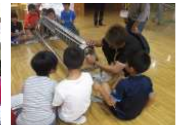
摘み取り機の詳しい説明