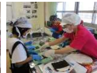
一口サイズの海苔巻き