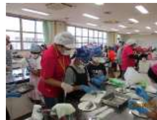
手を取っての海苔巻き体験