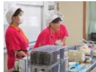
素敵なTシャツ姿の婦人部さん 若々しい青年部さん

芦刈観瀾校は日々、地域の皆様に支えて頂き、感謝をしています。今週は、4年生の学習に有明漁連の芦刈支部の方々に「有明海の家」について学習ボランティアとして来て頂きました。今週の月曜日（24日）は、芦刈漁協の婦人部の方々が有明海の家を使った食パン巻きを子どもたちといっしょに作って頂きました。水曜日（26日）は、青年部の方々が海苔の種付け、栽培、摘み取り、商品化について、摘み取り機やおいしい海苔を持ち込んで説明して下さいました。その時の様子を紹介します。婦人部と青年部の皆様、ありがとうございました。