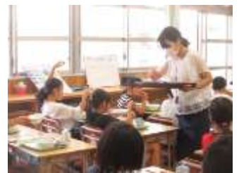
教室での海苔の配付