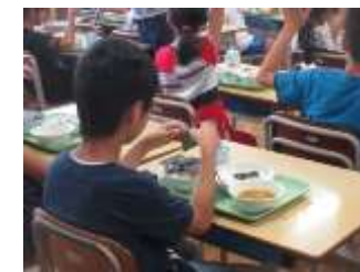
おいしい海苔の試食